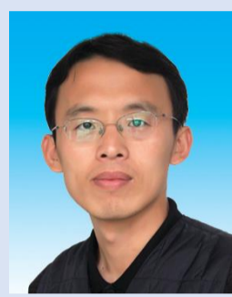
孙海信教授 厦门大学